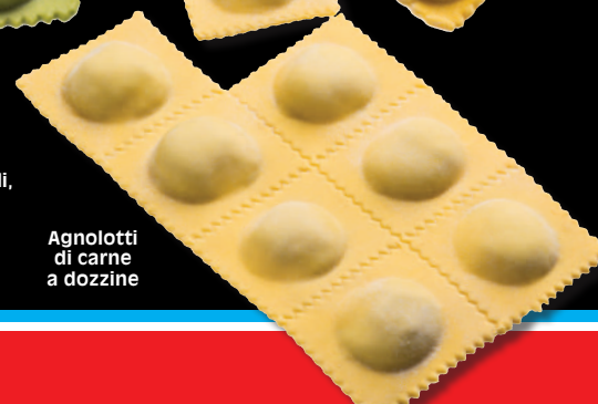
Agnolotti di carne a dozzine