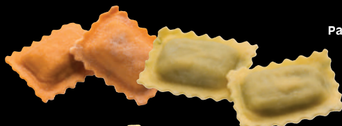
Ravioli alle burrage, carciofi Agnolotti ai funghi, al salmone