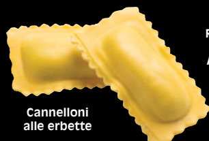
Cannelloni alle erbe