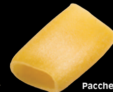
Paccheri e Mezze Maniche