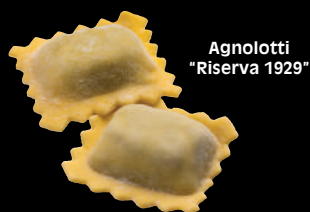
Agnolotti "Riserva 1929"