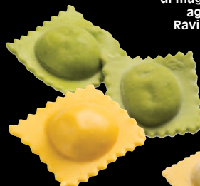
Agnolotti alla piemontese, di magro, di fonduta, agli asparagi Ravioli ai carciofi