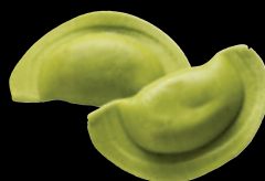
Panzerotti gran ripieno