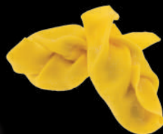
Trecce ricotta e spinaci