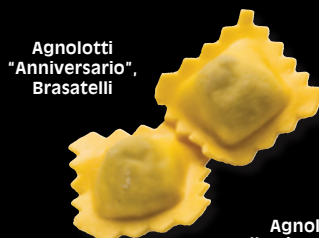
Agnolotti "Anniversario", Brasatelli