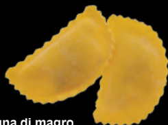
Mezzaluna di magro Pansotto ligure