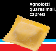
Agnolotti quaresimali, capresi