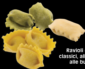
Ravioli del Plin classici, alle erbe, alle burrage