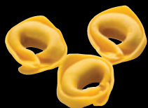
Tortellini alla Bolognese