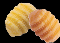
Gnocchi di patate, alla zucca