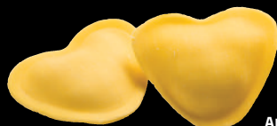
Amorini ai 4 formaggi