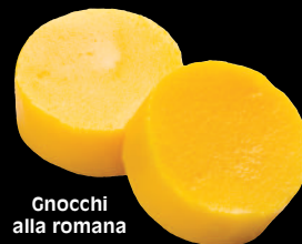
Gnocchi alla romana